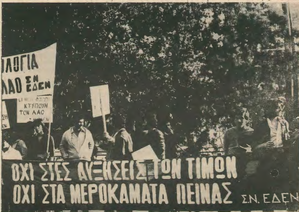
Απο την πικεττοφορία της ΕΔΕΝ ενάντια στη νέα φορολογία ρεπορταζ στη σελ. 2