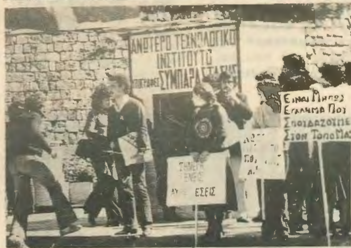
Αυτά είναι γενικά τα προβλήματα που αφορούν την επαγγελματική αποκατάσταση των αποφοιτών μας.